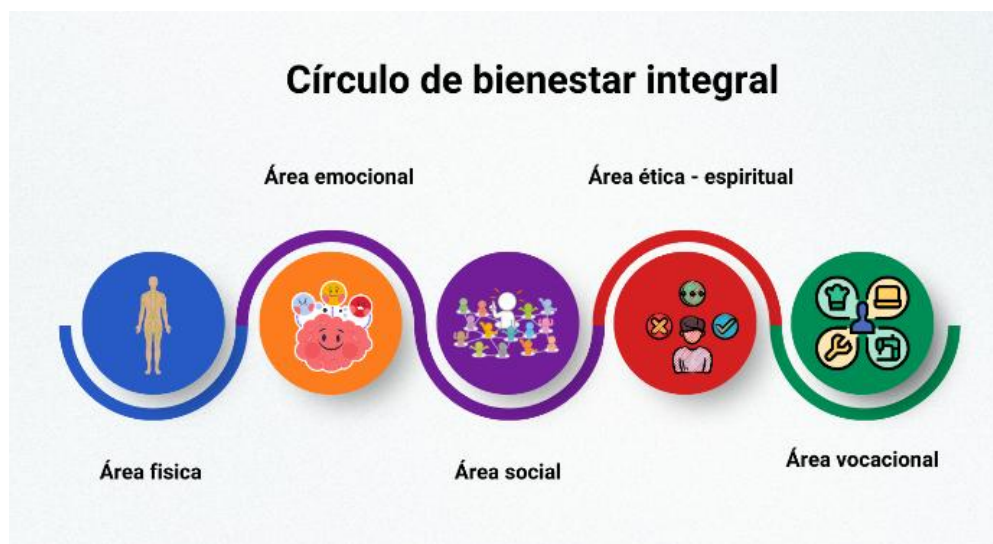
Imagen 2. Círculo de bienestar integral.

A continuación, se presenta una imagen sobre el círculo de bienestar integral y sus áreas: