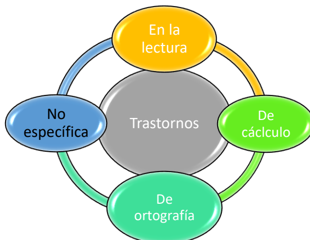
Figura 3 Desarrollo de Aprendizaje Lectoescritura