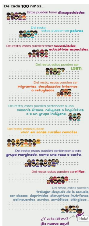
Figura demostrativa: Lo único que todos tenemos en Común son las diferencias.