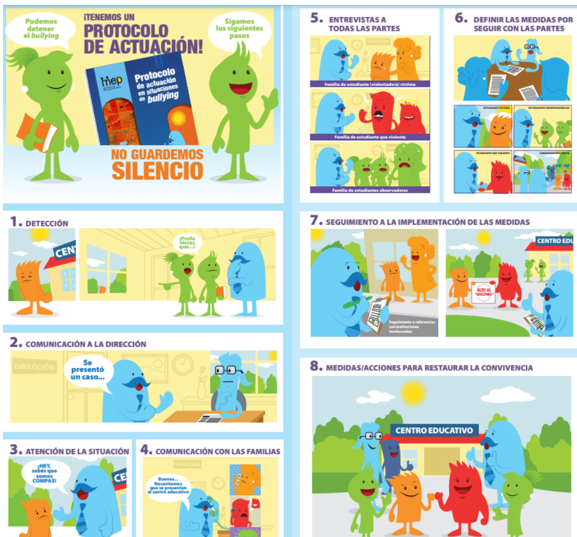
Ilustración 2: Ruta protocolo bullying

El protocolo de actuación sigue la ruta explicada en la siguiente ilustración: