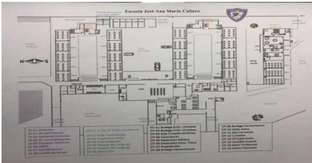
Ilustración 4: Croquis Escuela José Ana Marín