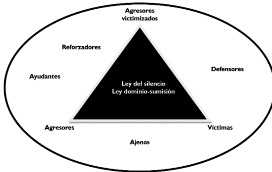
Ilustración 1. Representación gráfica de los implicados en el matonismo escolar

Nota: Fuente (Del Rey y Ortega, 2007, p.82).